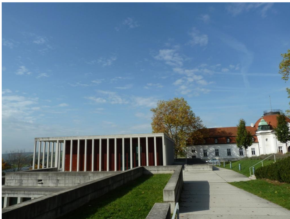
Pohled na Literaturmuseum der Moderne a Schiller National Museum

badatelských programů, otevřeným odborníkům z celého světa, kteří se zabývají německou literaturou a pochopitelně také filozofií. Kořeny společnosti sahají do roku 1835, kdy vznikl Schillerverein Marbach. V roce 1895 byl založen Schwäbischer Schillerverein, který je dodnes zastoupen ve výboru Deutsche Schillergesellschaft, stejně jako Weimarer Schillerverein, který byl založen v roce 1991. Původním cílem Schwäbischer Schillerverein byla dle preambule podpora znalosti Schillerova díla, jeho osoby a jeho idejí a za tímto účelem založení archivu a muzea v Marbachu . Založení Schiller National Museum v Marbachu bylo jedním z realizovaných záměrů původního spolku. Vznikla tím instituce, která se věnovala studiu a péči o odkaz Schillera a dalších švábských básníků a spisovatelů (Christopa Martina Wielanda, Johanna Christiana Friedricha Hölderlina, Eduarda Friedricha Mörike, Johanna Ludwiga Uhlanda a dalších). V roce 1903 byla otevřena budova muzea na Schillerhöhe a na jednotlivých výstavách, v publikacích a díky přednáškové činnosti byly zpřístupňovány archiválie literátů a výsledky bádání. V roce 1947 se spolek přejmenoval na Deutsche Schillergesellschaft. V roce 1955 byl založen Deutsches Literaturarchiv, jehož vznik byl výsledkem rozšíření dosavadní činnosti muzea na veškerou novější německou literaturu. V roce 2006 pak byla otevřena nová budova Literaturmuseum der Moderne jako výsledek projektu, který probíhal od roku 2002. Jeho budova je moderní variací na antický peripteros.