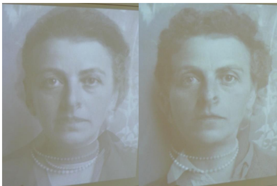
Kompozitní fotografie Helene a Ludwiga Wittgensteinových