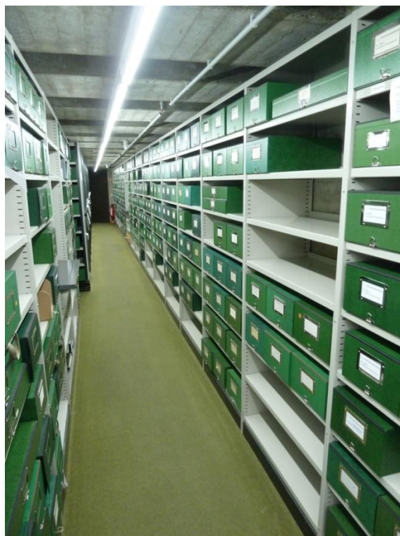
Ve sklepení archivu – den otevřených dveří

publikací v několika edičních řadách tematizují aktuální otázky v oblasti literatury a vědy a zpřístupňují jedinečné archiválie širokému publiku. DLA nabízí systém badatelských stipendií pro studenty i profesionální badatele. Badatel, který sem přijede, má vše k dispozici na dosah ruky, může se ubytovat přímo v areálu DLA (Collegienhaus). 2 Může využívat komfortních služeb knihovny a oddělení rukopisů, znalostí specializovaných knihovníků a pracovníků archivu. Každý stipendiant má přiděleného specializovaného konzultanta, na něhož se může obracet s dotazy v příslušné oblasti bádání. V době, kdy jsem měl možnost studovat zde dva měsíce pozůstalost Odo Marquarda, jsem se zde setkal s badateli z Jižní Koreje, Kanady, Velké Británie, Francie, Číny, Ruska, Polska, Mexika a pochopitelně z Německa a Rakouska. Knihy vám připravují k cedulce s vaším jménem v hlavním sále knihovny. O patro níže jsou ve volném výběru trvale k dispozici všechna souborná vydání textů německých filozofů. Z tohoto sálu se vchází do specializované čítárny rukopisů s proskleným stropem a jednou stěnou. Právě sem vám připraví pro DLA typické zelené archivní krabice, v nichž se uchovávají pozůstalosti.