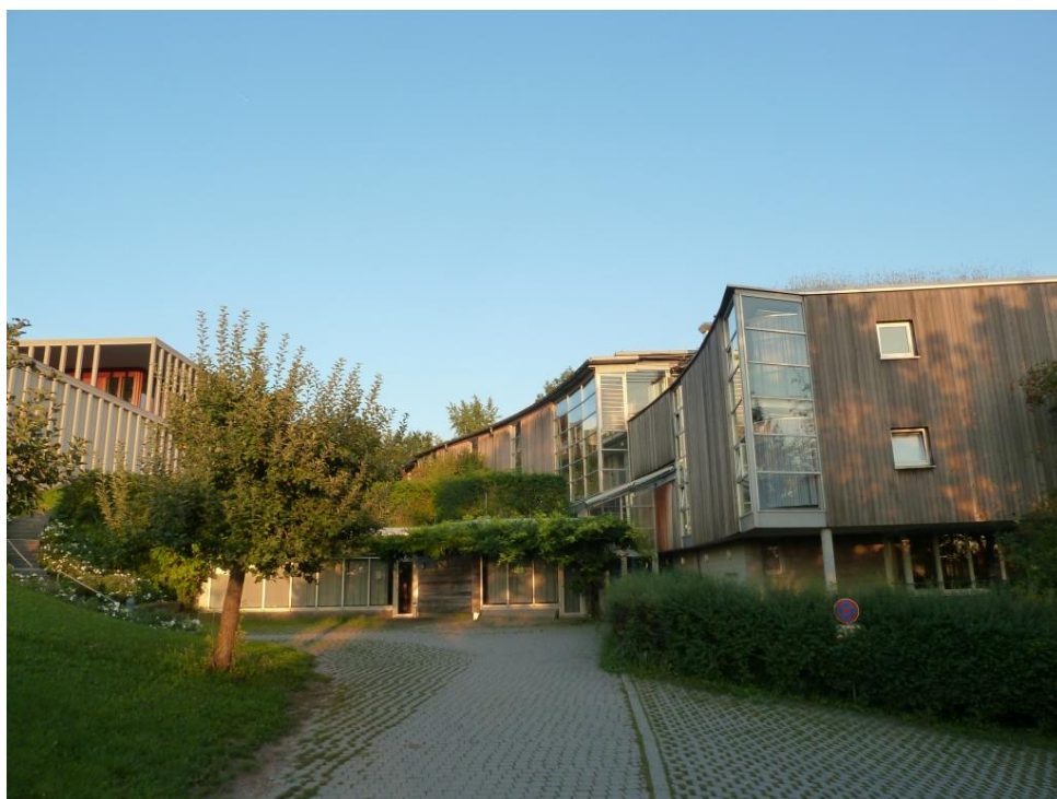
Vstup do Collegienhaus a nad ním Literaturmuseum der Moderne

autorů a antikvariátů nebo archiv knižních obálek. Naleznete zde cca 1 100 literárních a literárně vědných časopisů. Uloženy jsou zde zvukové a obrazové dokumenty, obrazy, sochy, medaile, grafiky, fotografie, plakáty, posmrtné masky. V hudební části lze nalézt notové partitury a nahrávky. Výsledky badatelské činnosti jsou publikovány v edičních řadách Marbacher Schriften, Spuren, Marbacher Faksimilie-Drucke, Jarbuch der Deutschen Schillergesellschaft – Internationales Organ für neuere deutsche Literatur, pravidelně vychází vynikající Zeitschrift für Ideengeschichte. Součástí jsou i další ediční počiny. 3 Sbírkou DLA s cennými prameny z oblasti literatury a duchovních dějin jsou otevřeny všem, kdo se chtějí věnovat pramennému výzkumu z profesních či soukromých zájmů. Při zevrubné prohlídce při příležitosti dne otevřených dveří jsem se dozvěděl, že současná kapacita knihovny a archivu je na hranici naplněnosti. Již nyní jsou některá depozita uložena i mimo Marbach. A objevuje se otázka po kapacitě ráje. Jednou z možností je digitalizace, která má z hlediska prostorového jistě výhody, ovšem připraví vás o fyzický kontakt s archiváliemi.