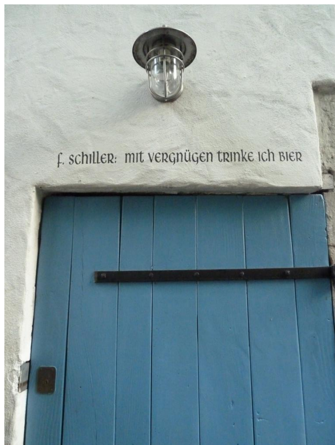
Citace bez uvedení pramene na stěně Salzscheuer Bräu v Marbachu