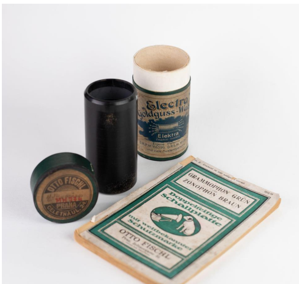
Obr. 1 Fonografický váleček (signatura MH 774) a historický katalog (signatura MZ 200) ze sbírek NM-ČMH

Uvedená databáze vznikala postupně od roku 2019 a je jedním z výstupů víceletého projektu pod VaV DKRVO (viz výše) zaměřeného na mapování a výzkum prodeje a distribuce nejstarších zvukových nosičů v českých zemích s důrazem na konkrétní historické osobnosti (prodejce, distributory, obchodníky, firmy ad.). Tento dílčí projekt koreloval se spuštěním projektu Nový fonograf (NAKI II 2018-2022, č. proj. DG18P02OVV032) a byl paralelně navázán na výsledky několika pilotních průzkumů, dokumentačních aktivit a výběrové digitalizace fondů fonotéky Národního muzea – Českého muzea hudby (dále jen NM-ČMH). Při průzkumu fondů fonografických válečků a standardních gramofonových desek (viz Benetková et al. 2019; Gössel et al., 2019), se na štítcích, nálepkách či razítkách, kterými byly osazeny nebo označeny etikety či historické obaly zvukových nosičů, objevovala jména těch, kteří tyto produkty tehdy vznikajícího zábavního hudebního průmyslu distribuovali či prodávali (viz obrázek 1).