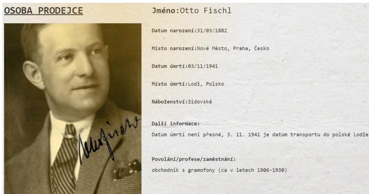
Obr. 3 Sekce Osoba prodejce v uživatelském rozhraní databáze

Sekce Rodina byla zahrnuta s cílem mapovat možné aktéřské sítě spojené s danou osobností. Některé osudy rodinných příslušníků mohou zajímavým způsobem doplňovat a dotvářet obraz biografie dané osoby, někteří členové rodiny mohli hrát klíčovou roli v podnikatelských aktivitách. Sekce Cestování byla motivována snahou ukázat geografickou mobilitu dané osoby, která měla mnohdy úzký vztah k jejím podnikatelským aktivitám (například návštěvou veletrhů, pracovním zaměřenými cestami apod.).