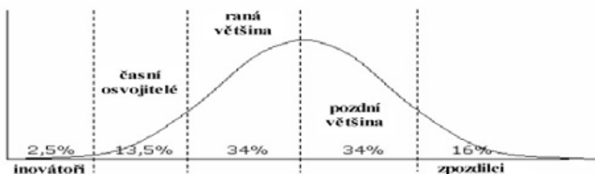
Obr. č. 2 Rogersova křivka 5

Rogers (1995) rozčlenil pět kategorií osvojitelů podle toho, v jaké fázi inovace si ji jednotliví členové sociálního systému osvojují. 4 Na obr. č. 2 je znázorněno zastoupení skupin osvojitelů inovace v populaci. Osa x představuje průběh inovace v čase, osa y relativní procento osvojitelů. Křivka je asymetricky rozdělena, v levé části se nacházejí 3 skupiny osvojitelů, v pravé dvě. V následující části textu představíme dominantní charakteristiky jednotlivých skupin osvojitelů inovací.