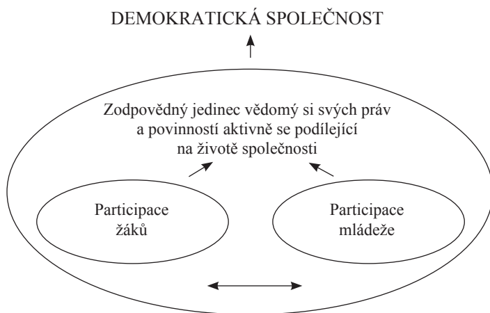
Obrázek 1: Model participace žáků a mládeže 4

Dnes existuje celá řada nejrůznějších více či méně širokých definic participace žáků. Český pedagogický slovník kolektivu autorů Průchy, Mareše a Walterové (2001) definuje participaci žáků jako charakteristiku „vyjadřující aktivní účast žáků v procesu výuky. V některých zemích se žáci zúčastňují rozhodování o cílech a obsahu vzdělávání a pravidlech života školy. Různými výzkumy je prokázáno, že